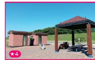
稲沢市営 祖父江ワイルドネイチャー緑地内 トイレと休憩所