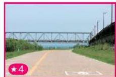
濃尾大橋下をくぐるサイクリングロード

9コースある50mプール、7コースある25mプールに児童用のスライダーがある徒歩プールがあります。