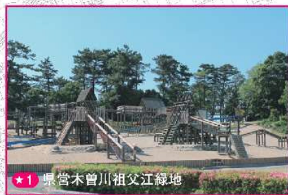
★1 県営木曽川祖父江緑地

南北両面に広がる公園をつないでいる道路です。クルマの通行がある所ですから、気をつけて走行してください。