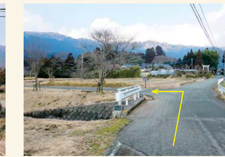
F 橋を渡って左に曲がる Cross the bridge and turn left.