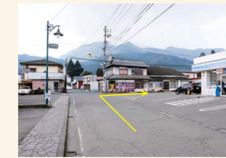
B コンビニエンスストア前を右に曲がる Turn right after the convenience store.