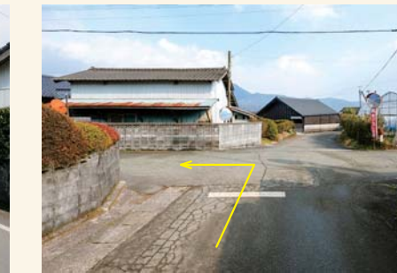
E カーブミラーを左に曲がる Turn left at the convex traffic mirror.