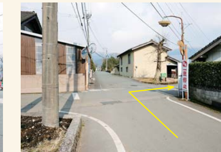
C カーブミラーを右に入る Take a right at the convex traffic mirror.