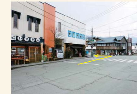
A 交差点を左に曲がる Turn left at the intersection.