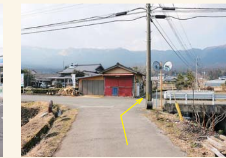
D 交差点を横断し川沿いに進む Cross the intersection and continue along the river.