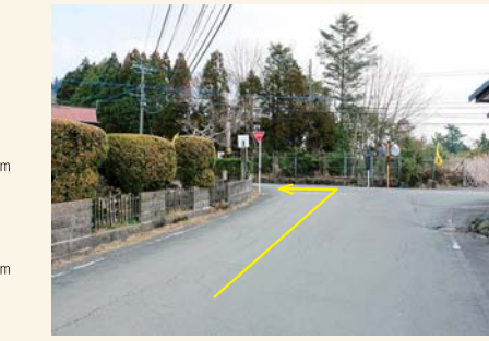
G T字路を左に曲がる Turn left at the T-junction.