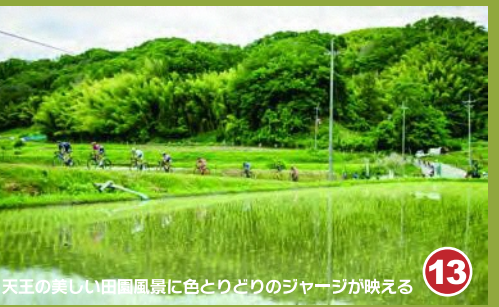
13 天王の美しい田園風景に色とりどりのジャージが映える