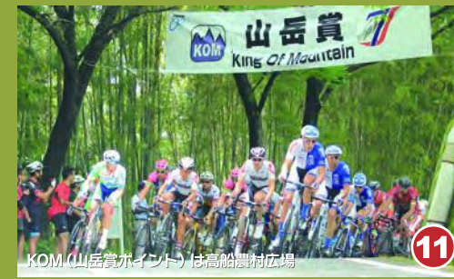
11 KOM(山岳賞争奪)は高船バス停前で