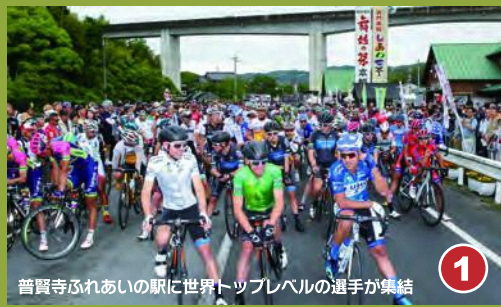
1 普賢寺ふれあいの駅に世界トップレベルの選手が集結