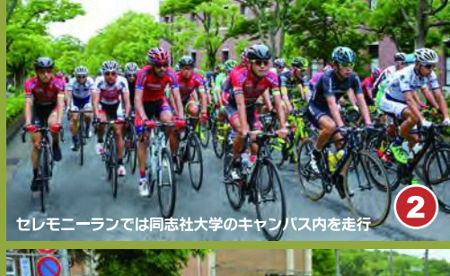
2 セレモニーランでは同志社大学のキャンパス内を走行