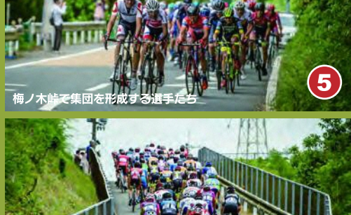
5 梅ノ木峠で集団を形成する選手たち