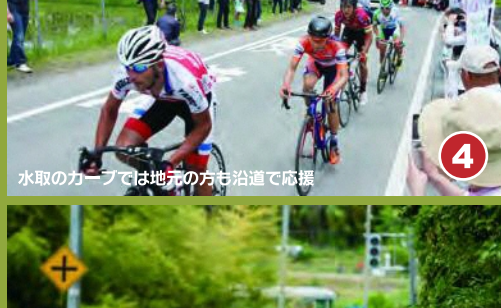
4 水取のカーブでは地元の方々が道で応援