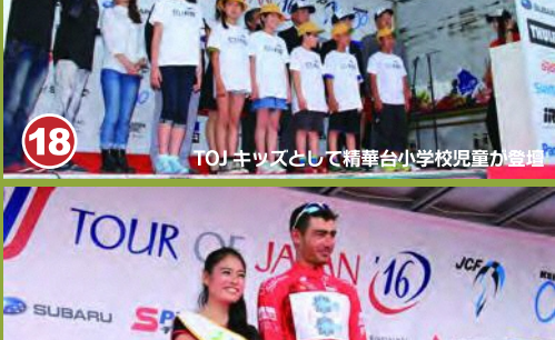
18 TOJキッズとして精華町小学校児童が活躍