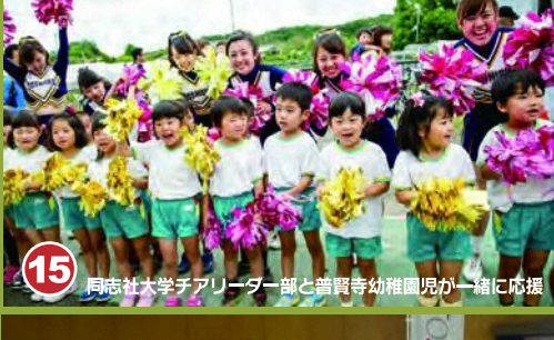
15 同志社大学アリーナ前と普賢寺幼稚園児と一緒に応援