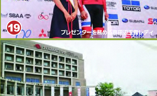
19 プレゼンターを務めるTOJキッズ