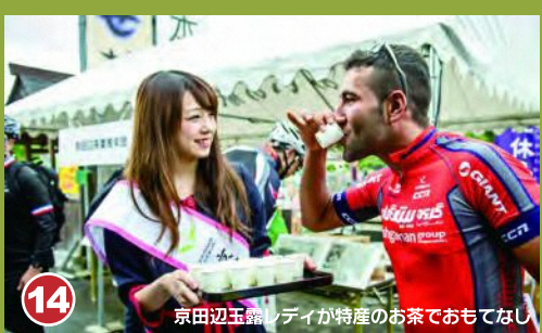
14 京田辺市で地元の特産のお茶をおもてなし