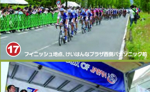
17 フィニッシュ地点、けいはんなプラザ西側パナソニック前