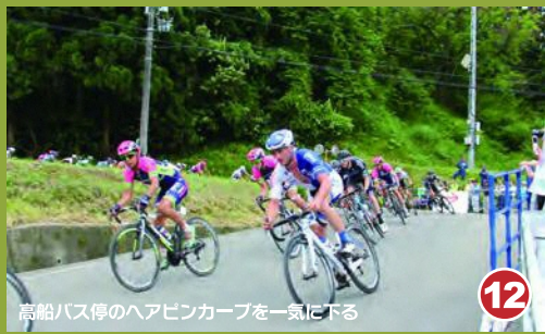
12 高船バス停のヘアピンカーブを駆け上がる