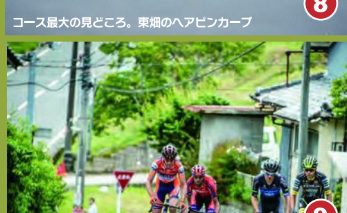
8 コース最大の見どころ、東照のヘアピンカーブ