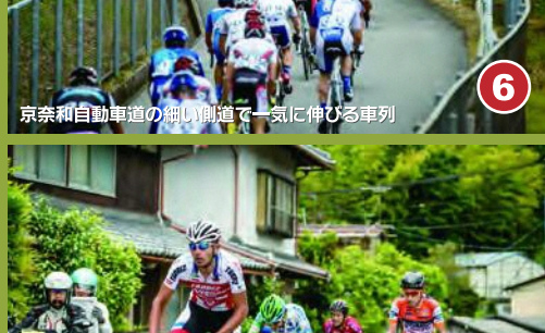
6 京奈和自動車道の鳥飼峠で一気に伸びる車列