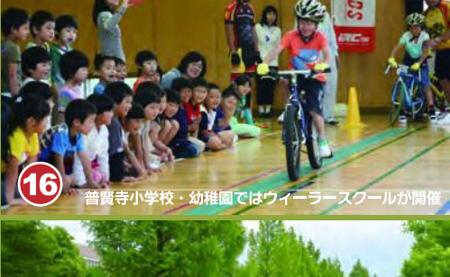
16 普賢寺小学校・幼稚園ではウィーラースクールが開催